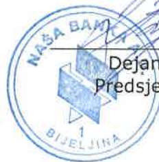
Dejan Vuklišević Predsjednik Uprave